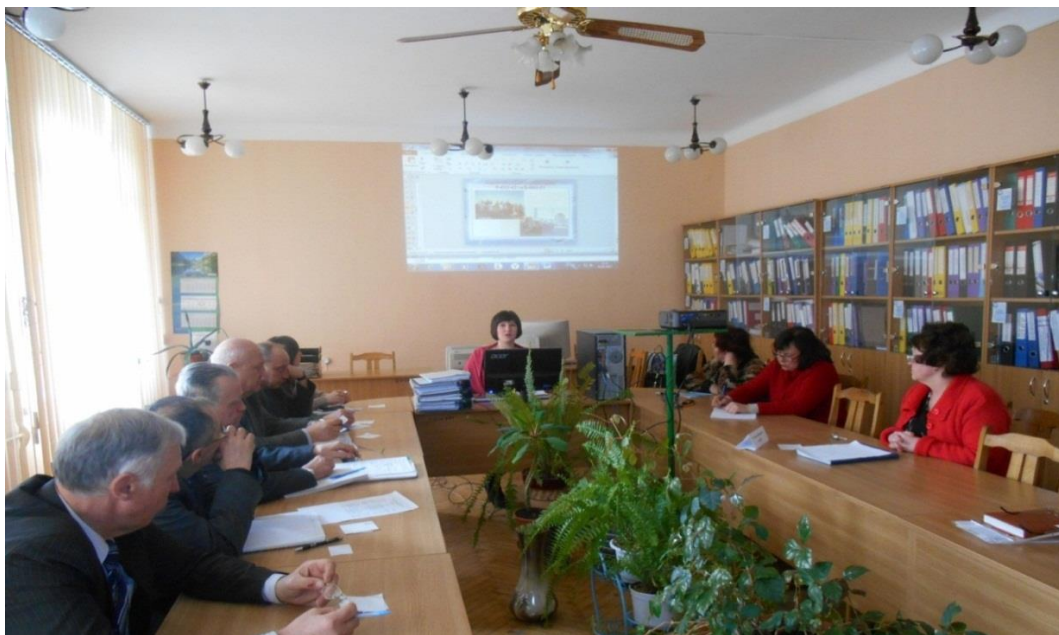
Засідання атестаційної комісії