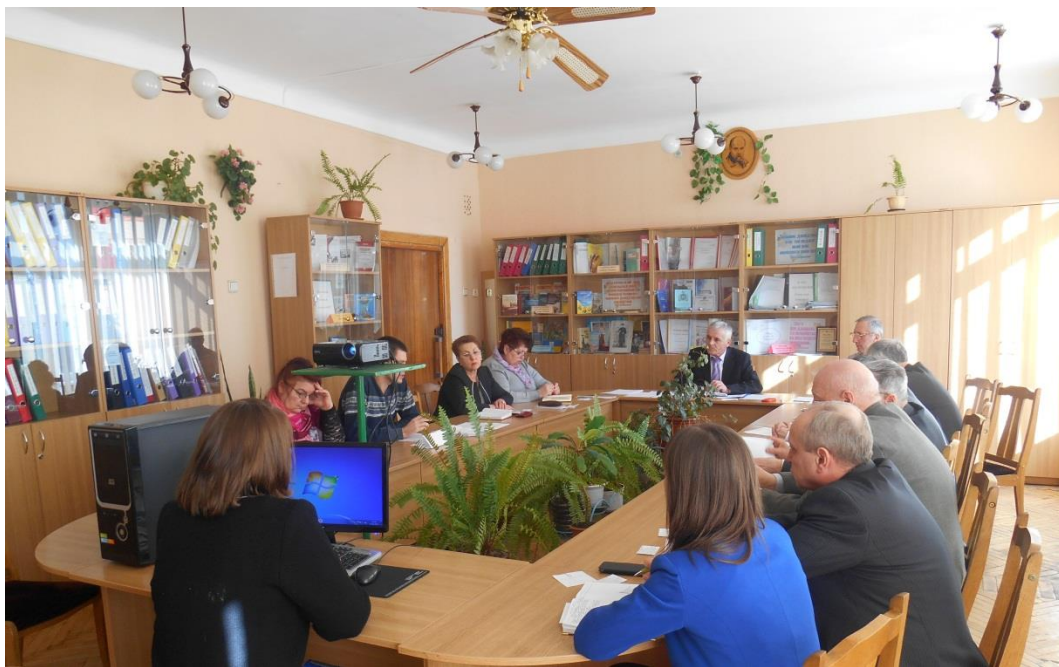
Засідання атестаційної комісії

Значення атестації величезне. Вона підвищує статус педагогічної професії, стимулює діяльність педагога до поповнення свого досвіду, допомагає визначити кращих викладачів. Отже з упевненістю можна стверджувати, що атестація — це підсумок професійної майстерності педагога, демонстрація його найкращих професійних умінь.