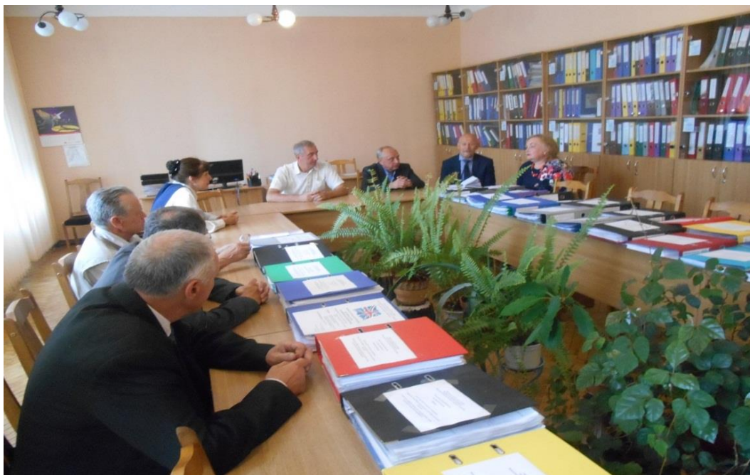
Засідання методичної ради

Методична рада, ураховуючи завдання, що поставлені перед педагогічним колективом, розглядає найбільш важливі питання удосконалення науково-методичної та навчально-виховної роботи в Коледжі, впровадження інноваційних технологій і прогресивних форм організації навчання в освітній процес, контролю і координації роботи циклових комісій, розробки заходів з підвищення професійної майстерності викладачі, а також реалізує й упроваджує рішення педагогічної ради.