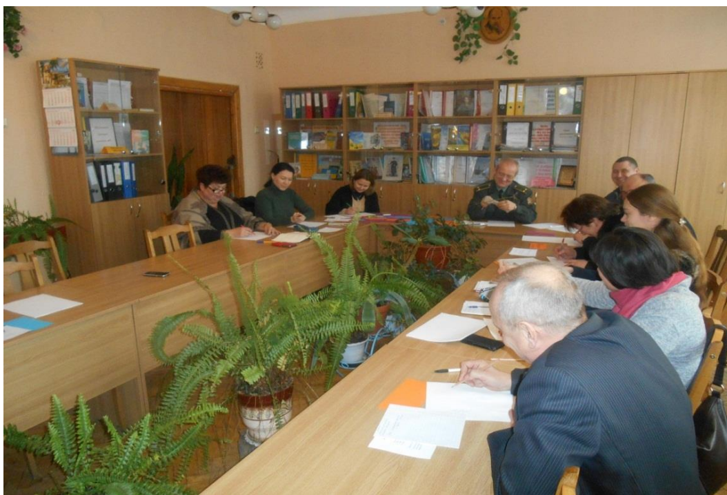
Тренінг у процесі психолого-педагогічного семінару